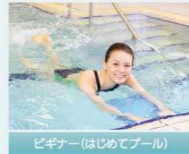
ビギナー(はじめてプール)