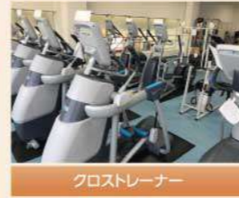
クロストレーナー