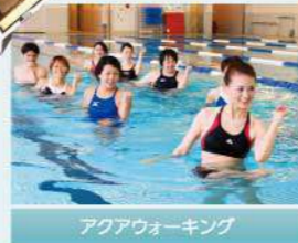
アクアウォーキング