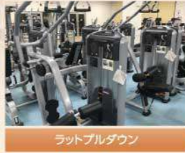
ラットプルダウン