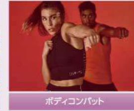
ボディコンバット