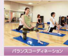
バランスコーディネーション

大人気のヨガやフラダンスをはじめ、週80本以上のプログラムを開催しています。 「筋力アップ」や「シェイプアップ」など目的に合ったプログラムが見つかります。