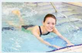
ビギナー(はじめてプール)

水の抵抗を活かして行う有酸素運動。水中のトレーニングは関節の負担が少ないため、無理なくトレーニングできます!