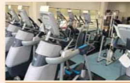
クロストレーナー/AMT

身体の脂肪を燃やしたい方におすすめ! ジョギングに比べて膝や腰への負担は少ないがカロリー消費は高いのが特徴。