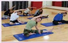
ベルビクストレッチ

動ける身体をつくるための効果的なトレーニングを組み合わせプログラム。筋力向上に加え、柔軟性やバランス感覚の向上もめざまし。