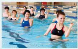
アクアウォーキング

水中のエクササイズを音楽に合わせて行うクラス。膝や腰への負担が少ないため、運動初心者の方もおすすめ。