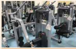
ラットプルダウン

背中トレーニングをすることで、猫背等の姿勢改善。シェイプアップにも欠かせないメニューです。