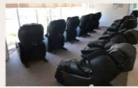
マッサージチェア

爽快に汗がかけると人気です。高い血行促進効果があり、疲労回復、肩こり、腰痛やリフレッシュにオススメです。