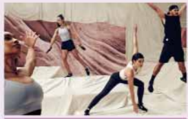
レズミルストーン

格闘技の様々な動きを取り入れた、初めての方でも楽しめる、ストレス発散&カロリー燃焼プログラム。