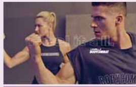
ボディコンバット

格闘技の様々な動きを取り入れた、初めての方でも楽しめる、ストレス発散&カロリー燃焼プログラム。